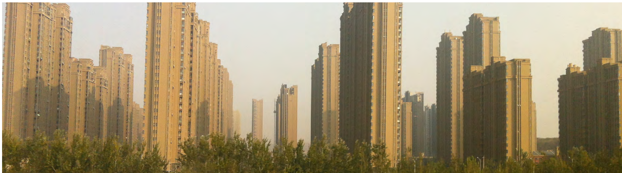
Photo prise en Chine en novembre 2014.